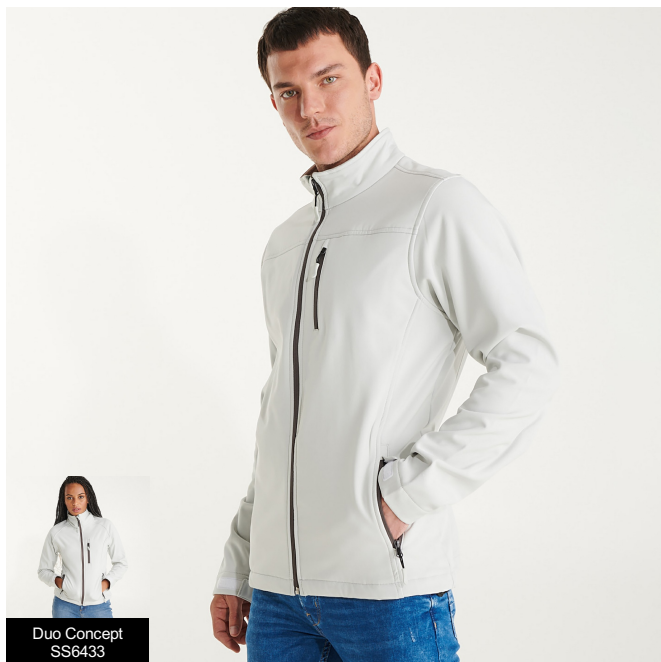
Duo Concept SS6433