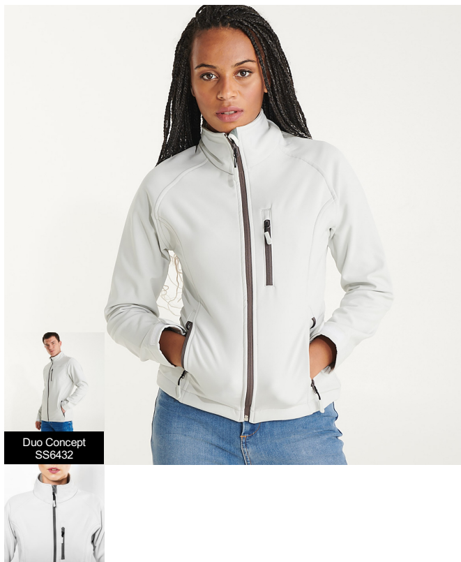
Duo Concept SS6432